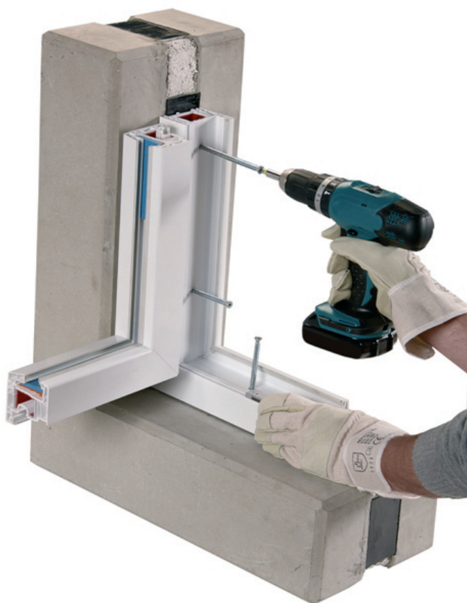
Anker bei der Montage (oben) und unbearbeitet (u. li.) sowie verarbeitet (u. re.)